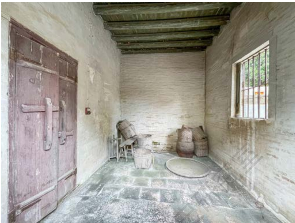
中山人民抗日义勇大队部旧址内部一角

该房屋建于20世纪20年代，坐北朝南，含左右两屋，中夹小巷。左屋为砖木结构的二层楼房，硬山顶，水磨青砖外墙。右屋为高两层的砖混结构建筑。建筑前有院落，分布面积约为155平方米。