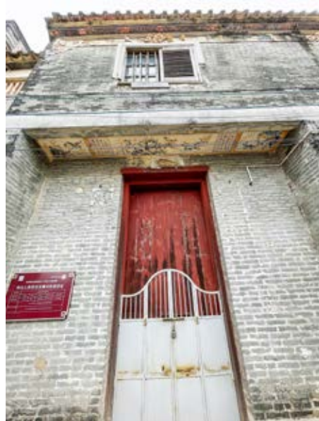
中山人民抗日义勇大队部旧址正门（黄春华摄于2022年2月）

该旧址于2012年1月被中山市人民政府核定公布为中山市不可移动文物；2006年6月被中共中山市委核定公布为中山市革命遗址，并作为中共中山市委党史教育基地。