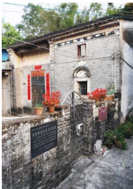
中共中山本部县委旧址周边全景（黄春华摄于 2023 年 3 月）

该旧址建于清末民初，房屋坐南向北，建筑面积约 61 平方米，建筑物和院子占地约 139 平方米。建筑分为东西两间：东侧房屋为两层结构，西