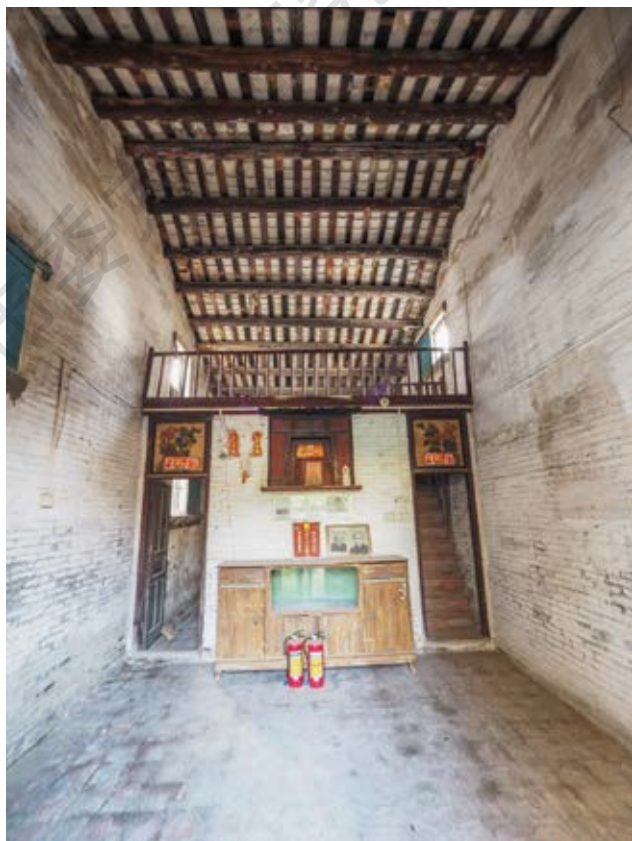
中共中山县四区委员会活动旧址内景