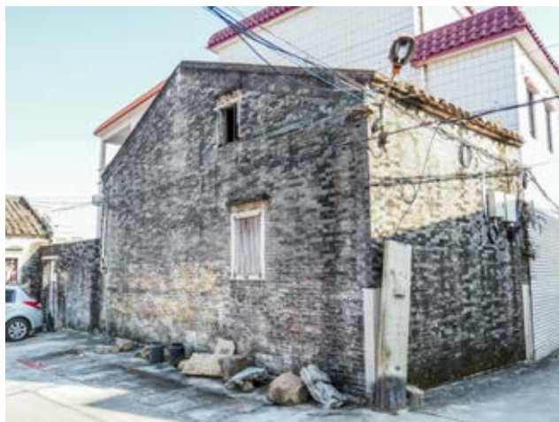
中共中山县四区委员会活动旧址侧面（黄春华摄于 2020 年 10 月）

该旧址建于民国时期，坐西北向东南，面积约 158 平方米。主座原为单间两进，现仅存单间一进。前有院落、围墙和一间副屋。主屋一层，前厅后房，属青砖金字瓦房。1964 年，该房屋因台风倒塌，留下破损的院墙、屋墙，大门地基。