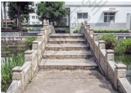
香山学宫泮池拱桥——中共中山县工委活动遗址石桥台阶