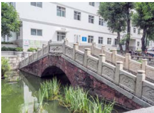
香山学宫泮池拱桥——中共中山县工委活动遗址侧面（黄春华摄于2020年10月）