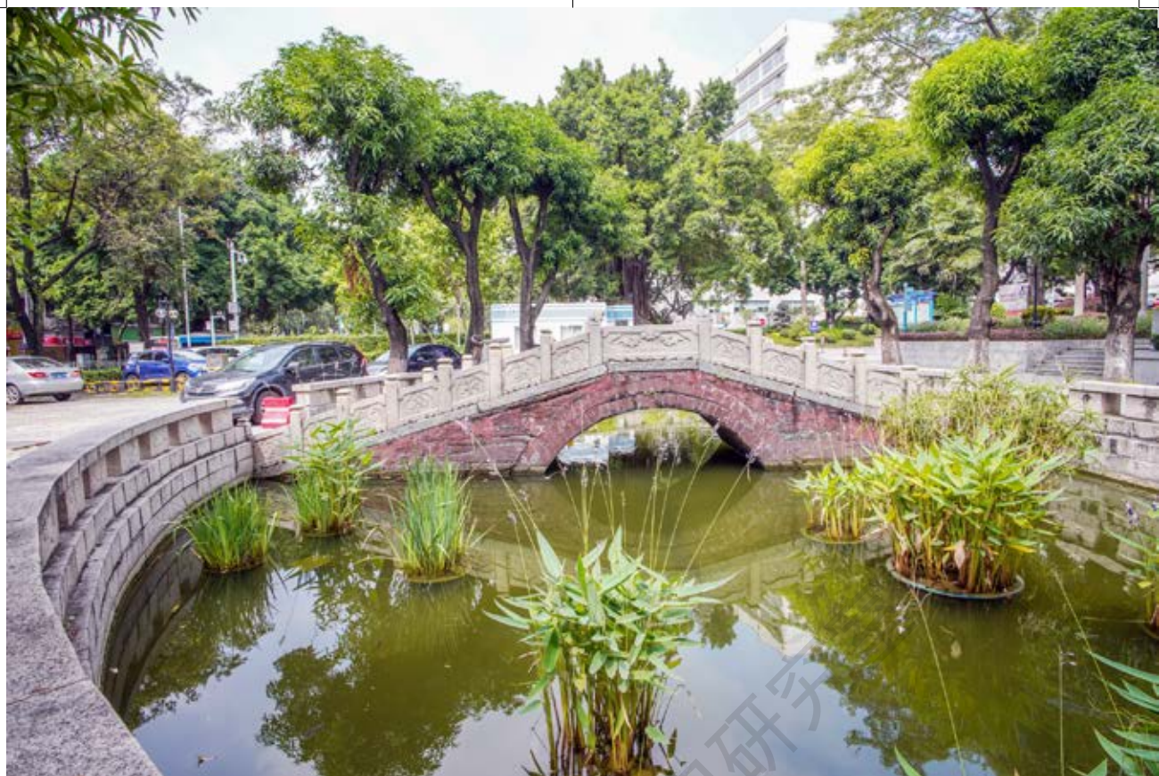
香山学宫泮池拱桥——中共中山县工委活动遗址全景