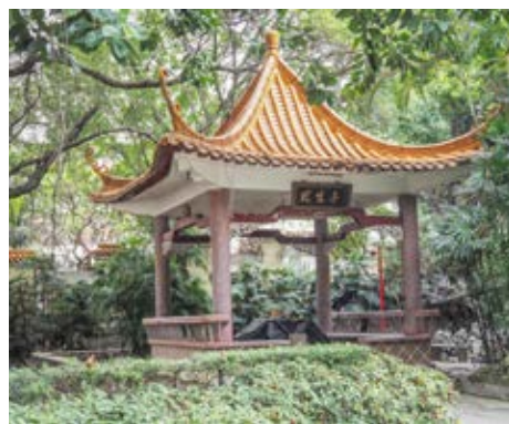
小榄革命烈士纪念碑所在山下建有“犹生亭”

写。从碑后侧直上45级台阶处建有烈士墓一座，陵墓呈大圆顶形，直径3.6米，面积约41平方米。陵墓内安放着59具革命烈士遗骨。墓碑两侧分别立有三九区“四一二”战斗殉难烈士芳名碑和三九区革命烈士芳名碑，最外侧两边立有“热血洒中山功垂史册，英魂飘凤岭景仰勋名”石刻挽联。墓地、纪念碑保存完好，碑文清晰可见。纪念碑所处山下还建有怀烈亭和犹生亭。