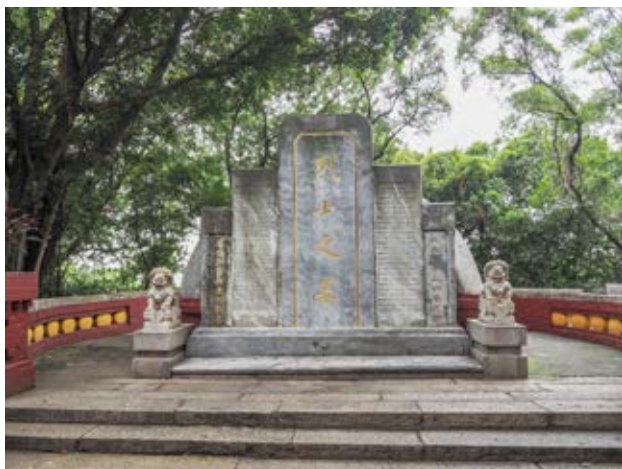
小榄革命烈士纪念碑后的烈士墓（黄春华摄于2020年10月）