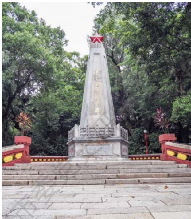
小榄革命烈士纪念碑正面全景

该纪念碑坐东北向西南，由纪念碑和烈士墓组成，总面积约49平方米。纪念碑平面呈正五边形，高12.5米，基座底周长12.92米，正面镶嵌有阴刻石碑记“革命烈士斗争史志”，其余四面按顺时针方向阴刻有“革命英魂”“气壮山河”“浩气长存”“永垂不朽”字样。碑体自下而上逐渐内收，顶为卷轴状，饰立体五角红星，正面阳刻“革命烈士纪念碑”字样，为原中区纵队、珠江纵队司令员，广东省副省长林锵云题