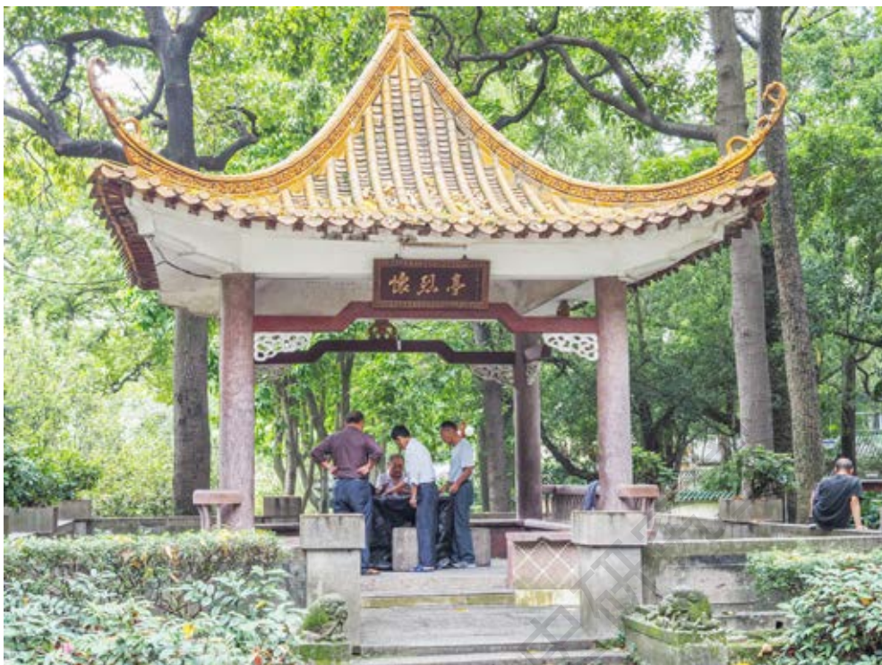
小榄革命烈士纪念碑所在山下建有“怀烈亭”（黄春华摄于2020年10月）

写。从碑后侧直上45级台阶处建有烈士墓一座，陵墓呈大圆顶形，直径3.6米，面积约41平方米。陵墓内安放着59具革命烈士遗骨。墓碑两侧分别立有三九区“四一二”战斗殉难烈士芳名碑和三九区革命烈士芳名碑，最外侧两边立有“热血洒中山功垂史册，英魂飘凤岭景仰勋名”石刻挽联。墓地、纪念碑保存完好，碑文清晰可见。纪念碑所处山下还建有怀烈亭和犹生亭。