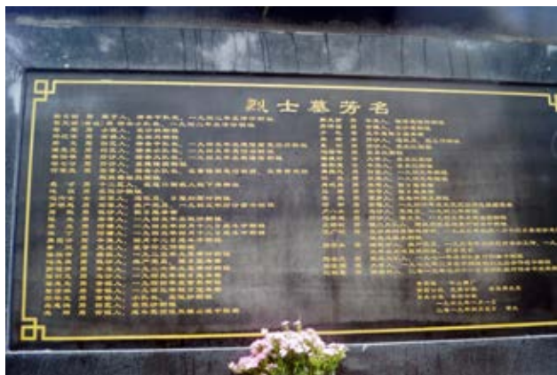
黄圃革命烈士纪念碑烈士墓芳名石刻 (《中山日报》记者摄于2020年4月)