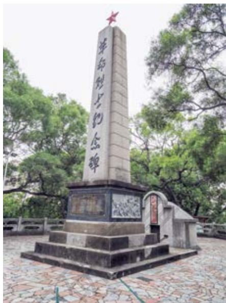
黄圃革命烈士纪念碑

该纪念碑旨在纪念在国内革命战争、抗日战争和新中国成立后牺牲的50名烈士。其基座为三级台阶，碑体呈梯形，碑高10米，底周长14.4米；碑体正面阳刻“革命烈士纪念碑”七字，碑顶有一枚红色五角星，碑座正