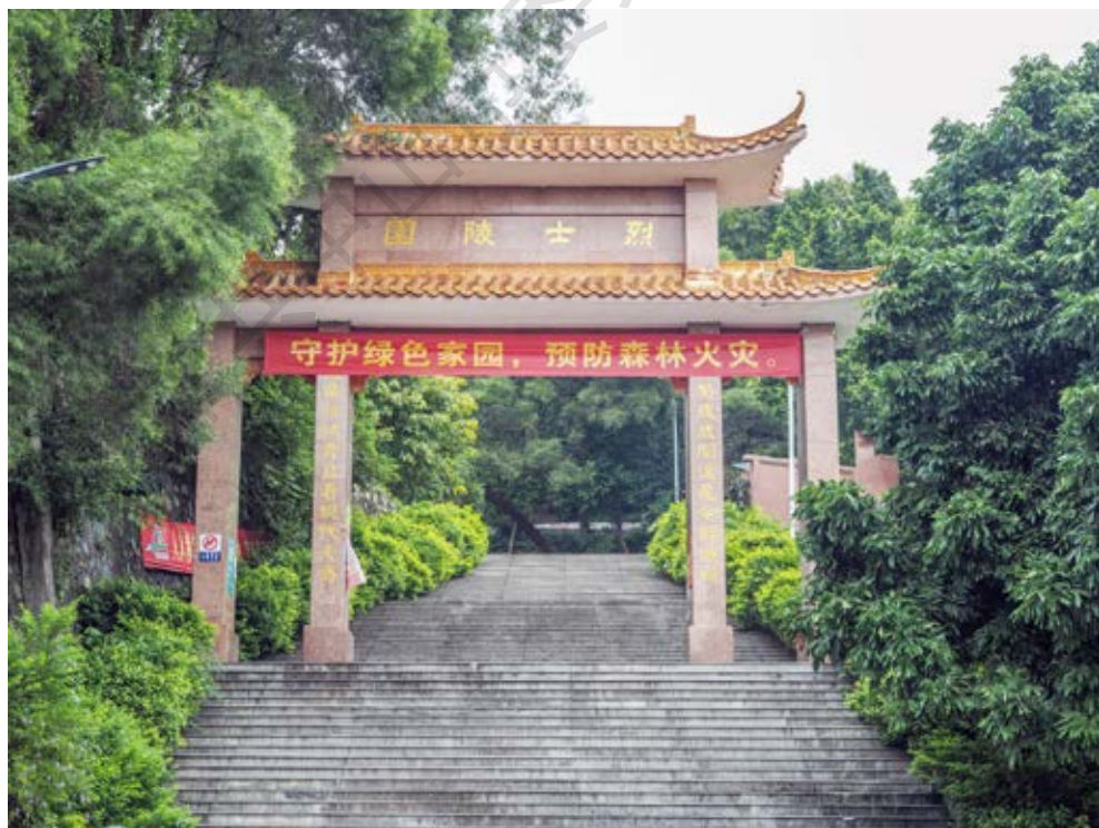
黄圃革命烈士纪念碑牌坊