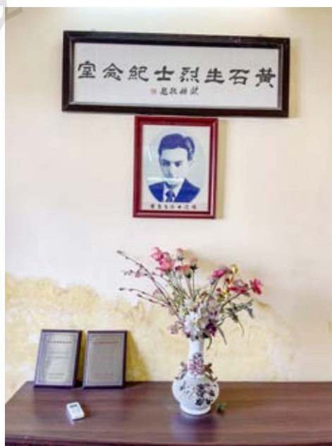
肇园——黄石生中队队部旧址二楼纪念室陈列一角

黄石生中队与杨子江中队、周增源中队等以公开合法的身份活动在二区及城郊西北部一带，逐步形成了民田地区与沙田地区相呼应，建制部队与民兵武装力量相结合，以及发展武装队伍与开展青年群众运动相结合的形势，成为共产党所掌握的中山抗日