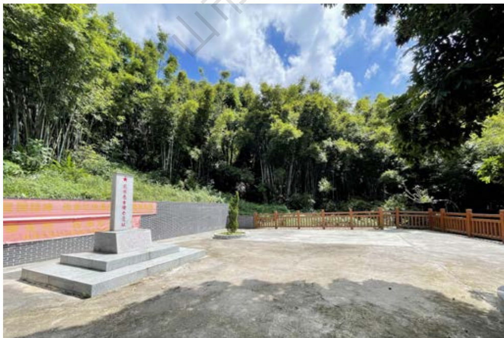
担水坑抗日志士阵亡遗址全景