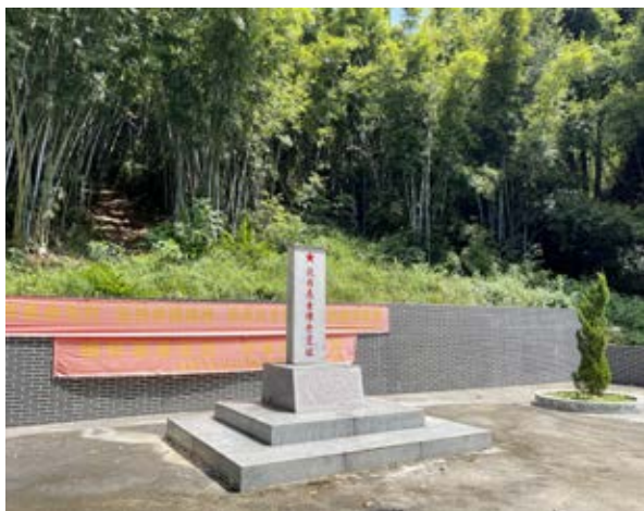
担水坑抗日志士阵亡遗址纪念碑正面（左）及侧面

敌军占领三面高地，居高临下，用轻重机枪、手榴弹、迫击炮等强大火力，企图一举歼灭游击队。游击队仓促应战，顽强抗击敌军，由于敌众我寡，火力悬殊，游击队所处地形又不利于作战，致使20多名指战员壮烈牺牲，多名指战员被俘。日、伪军将被俘的战士押到金钟海，抛下江河淹死。此役只有梁豪、苏桂标、贺添、甘添仔、萧植生等几名战士突出敌军重围，回