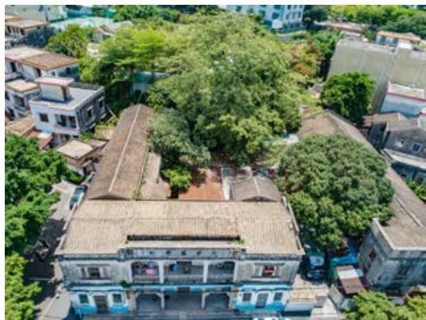
中山解放中山独立团集结地旧址大鳌溪学校俯瞰