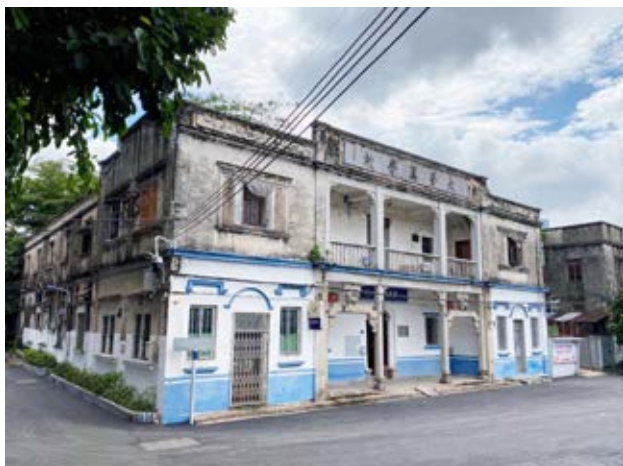
中山解放中山独立团集结地旧址侧面外景