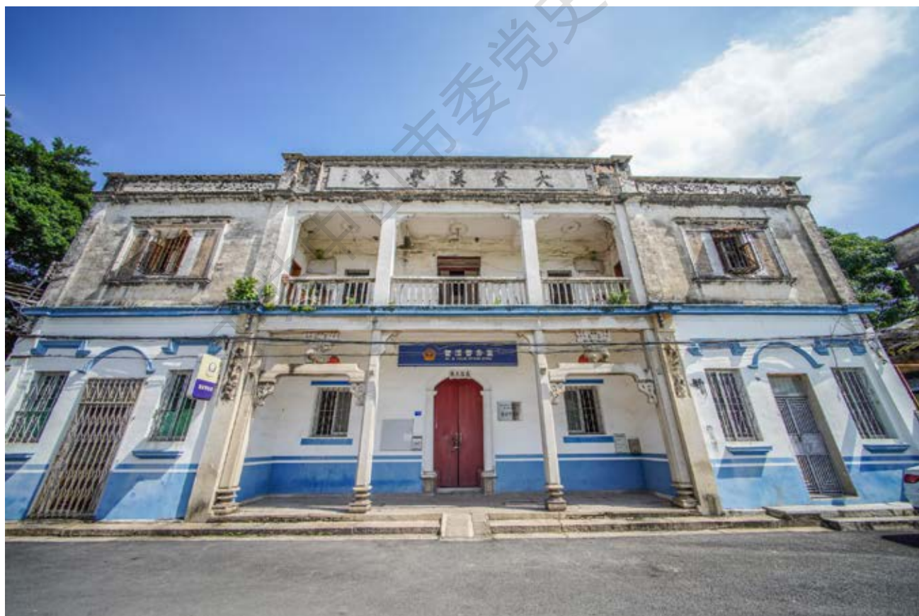
中山解放中山独立团集结地旧址正面全貌（黄春华摄于2020年10月）

山县委员会、中国人民解放军粤赣湘边纵队中山独立团取得联系，议定于10月30日在石岐会师。同日，中山人民欢迎人民解放军暨庆祝中山解放筹备处召集各人民团体、社团学校及地方开明人士等60多人齐聚商会礼堂，议定于30日上午11时前组织群众到达石岐南门华佗庙车站，欢迎解