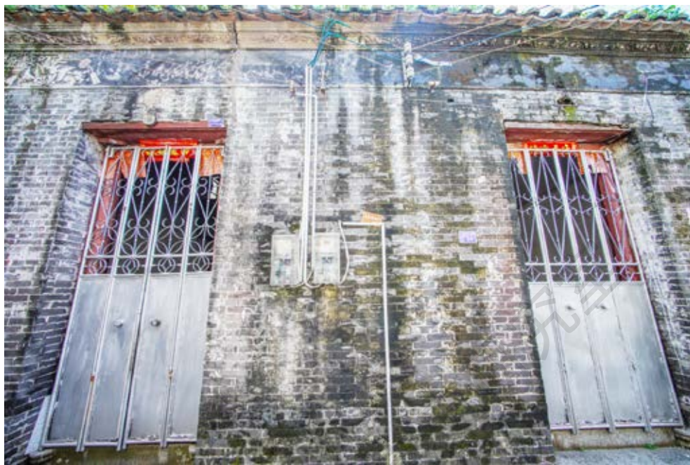
中共中山本部特派员活动旧址（右）正面（黄春华摄于2020年10月）

中共中山本部特派员活动旧址位于中山市南朗街道关塘行政村东槿自然村民乐街五巷24号。