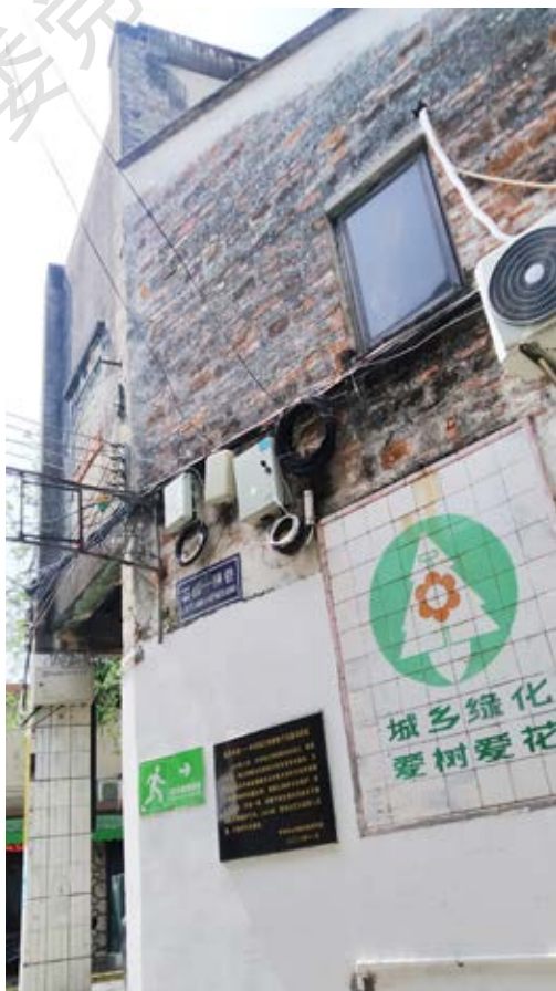
右上：良友书店——中共珠江特委地下交通站旧址周边全景