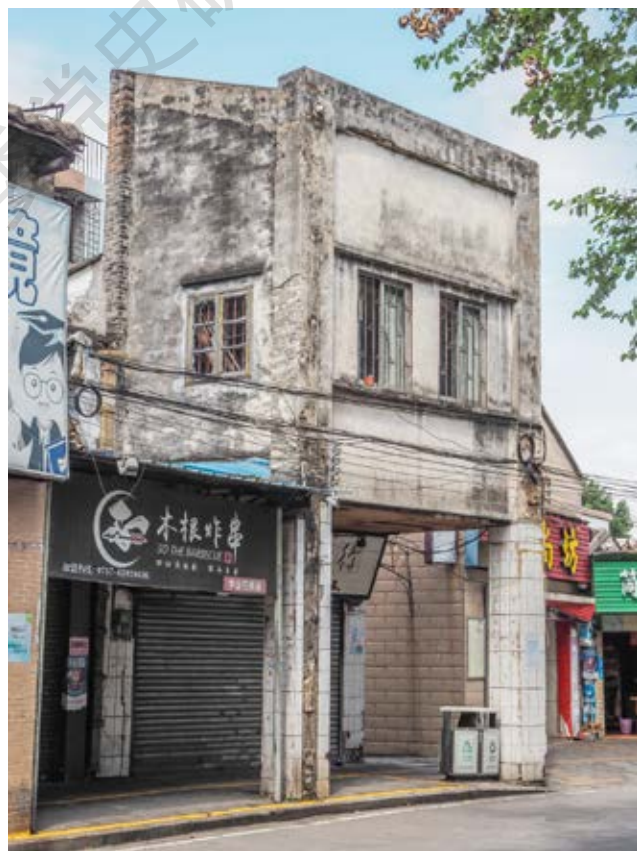
良友书店——中共珠江特委地下交通站旧址正面（左）及侧面