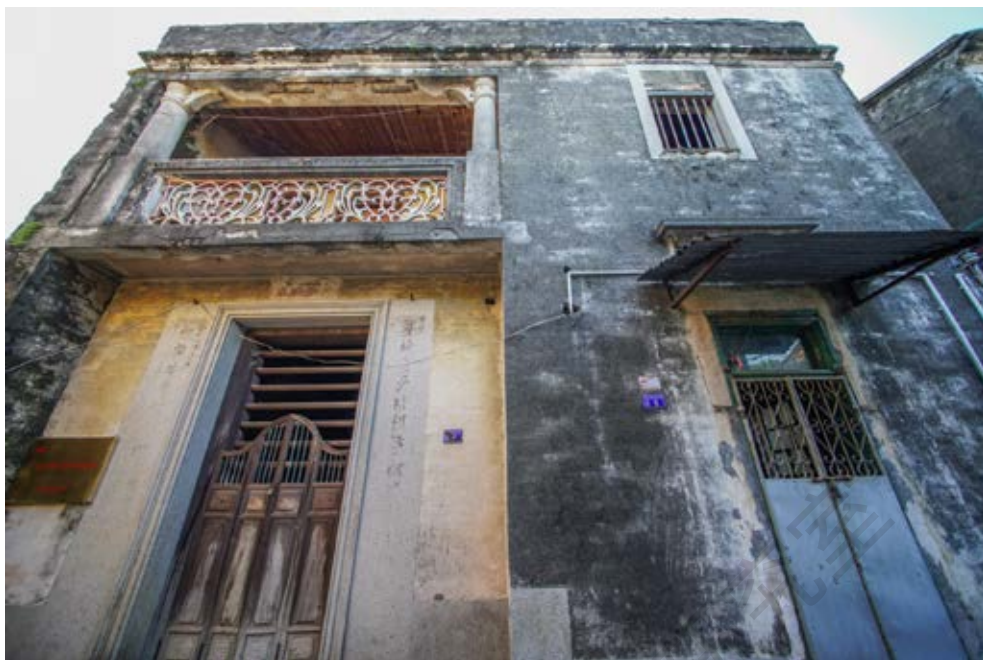
抗日民主政权五桂山区中心支部活动旧址整座建筑物正面全貌（黄春华摄于2020年10月）

产党员气节教育，使大家对形势有清醒认识，有应付最困难环境的信心和意志。因此，虽然国民党反动派不时到各村去“扫荡”，骚扰群众，但中共党员仍坚持斗争，晚上抓紧机会对群众进行宣传教育，从而使在形势转