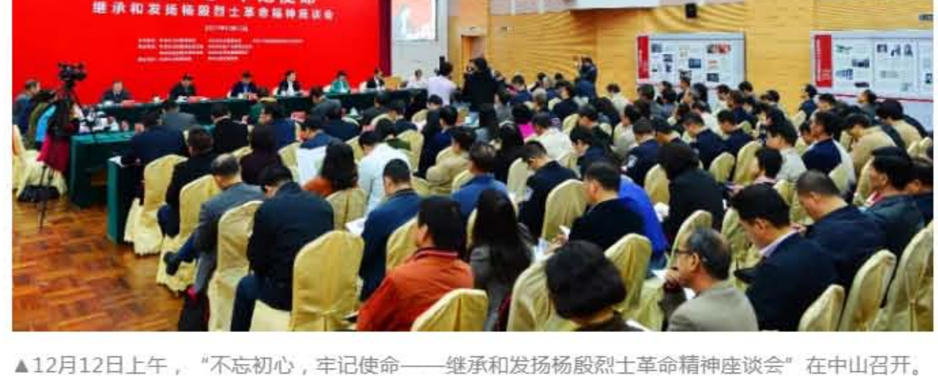
▲12月12日上午，“不忘初心，牢记使命——继承和发扬杨殿烈士革命精神座谈会”在中山召开。

今年是中共早期领导人、中山革命先烈杨殿同志诞辰125周年，也是杨殿同志参与领导的广州起义爆发90周年。12月12日上午，由中共中山市委组织部、中共中山市委宣传部、中共广州医药集团有限公司委员会主办的“不忘初心，牢记使命——继承和发扬杨殿烈士革命精神座谈会”在中山召开。市领导以及国内嘉宾学者、杨殿烈士后人代表等齐聚一堂，深入学习贯彻党的十九大精神，以习近平新时代中国特色社会主义思想为指引，缅怀先辈不朽功勋，开展革命传统教育，推动红色基因、红色文化在新时代焕发新的光彩。