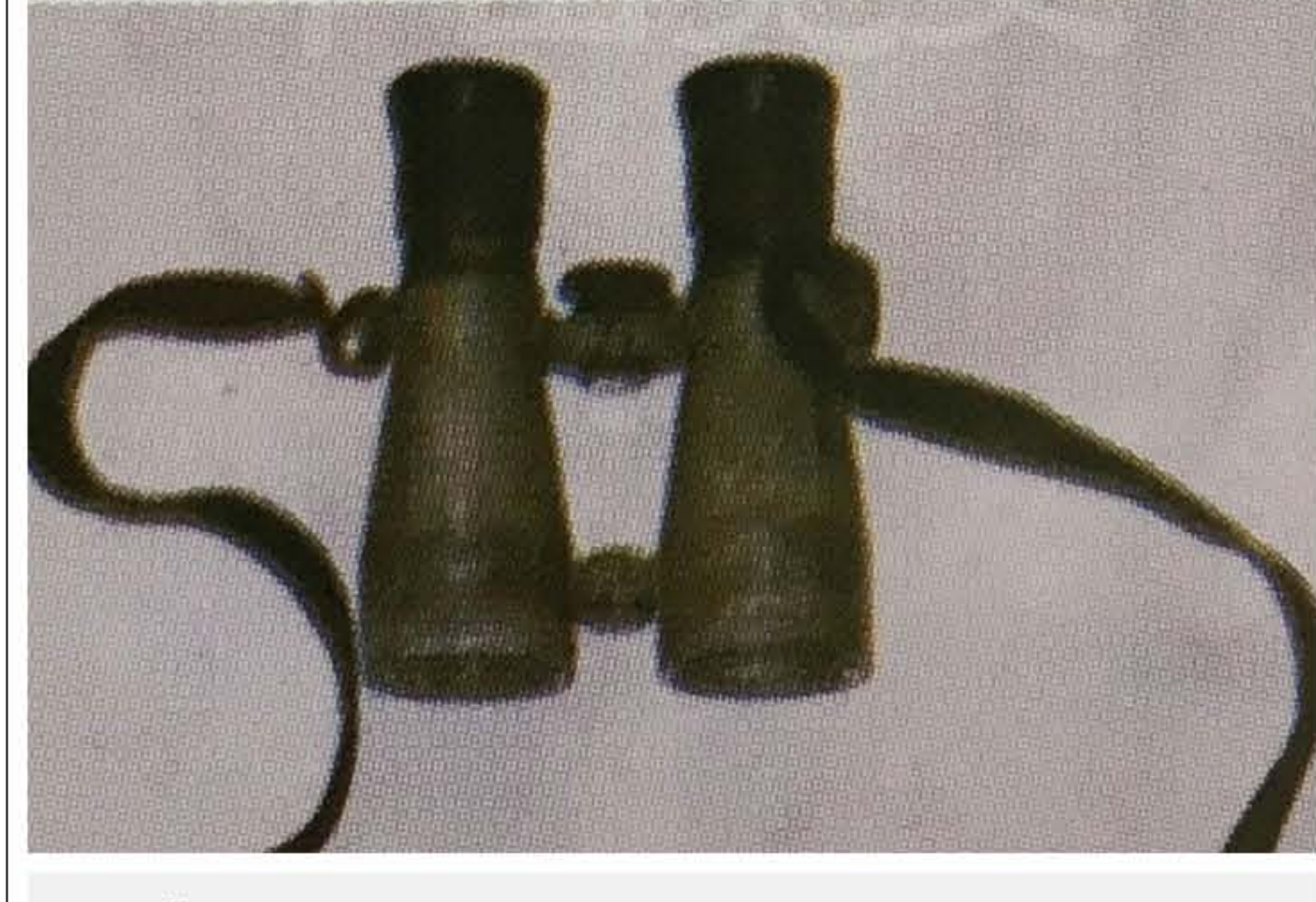
▲日子源缴获的日军枪套和望远镜。

三山虎山战斗中，猛虎队、民权队英勇顽强，以少胜多，圆满完成阻击来犯之路日、伪军的任务，为司令部与支队机关转移赢得了时间。荡气回肠的“三山虎山血战”故事，至今仍在五桂山人民群众中广泛流传。