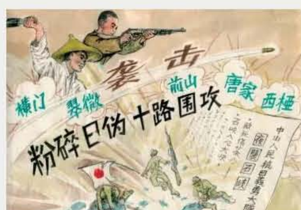
五桂山军民团结一致共同抗战，采用全面牵制、攻其一路的麻雀战术，仅5天就彻底粉碎了敌人的“十路围攻”。

撰稿：汤翩翩 版面设计：郑欣 来源：《抗战烽火 中山记忆》 九·一八特别策划（十二）