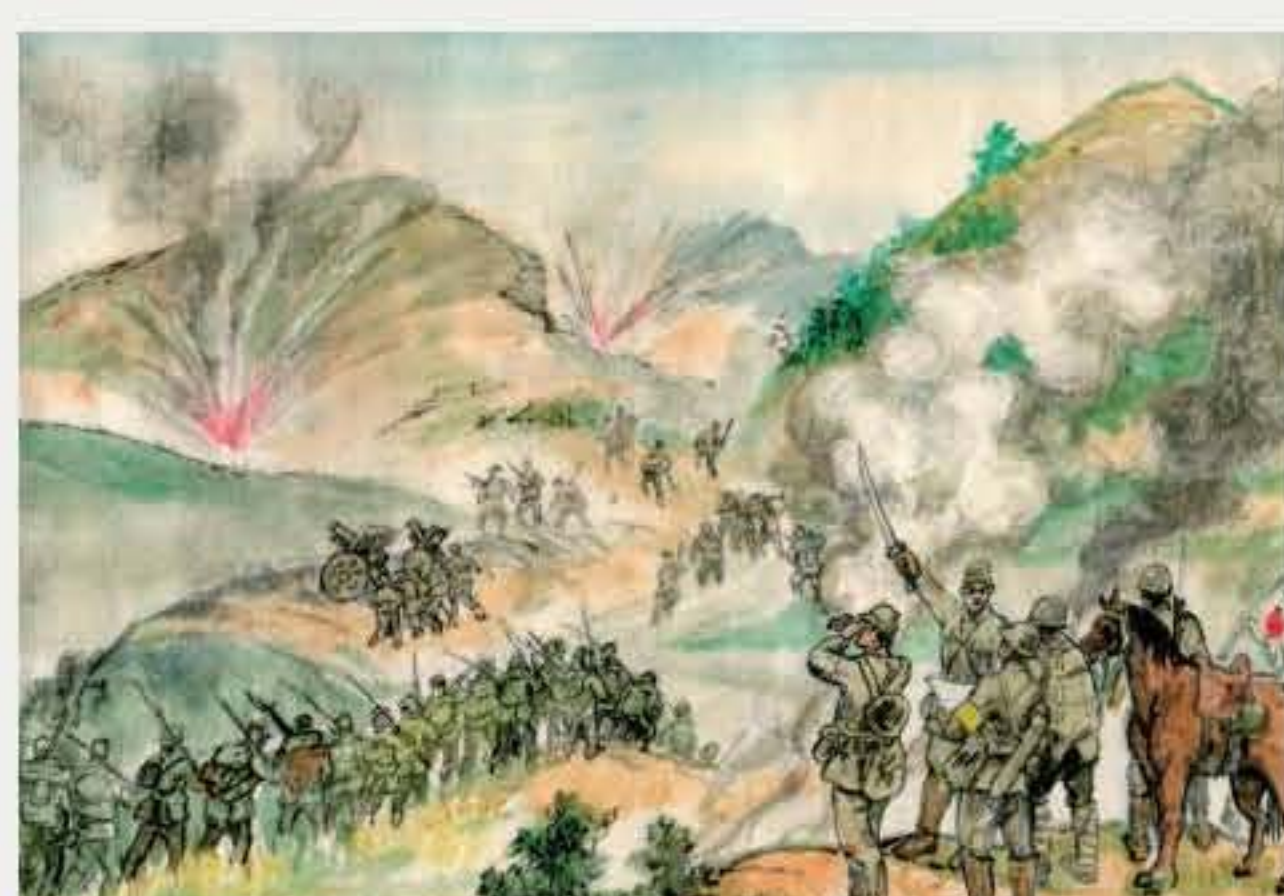
1944年1月31日，驻中山的日、伪军共8000多人，分十路围攻五桂山区，号称万人大大“扫荡”。

此战共毙伤日、伪军120多人，缴获步枪18支，烧毁敌兵营一座，并截回物资一批。日、伪军原计划一个月的“十路围攻”，仅5天就被中山抗日军民所粉碎。反“十路围攻”的胜利，打击了日、伪军的士气，保卫了五桂山抗日根据地人民的生命财产，提高了军民抗战必胜的信心。