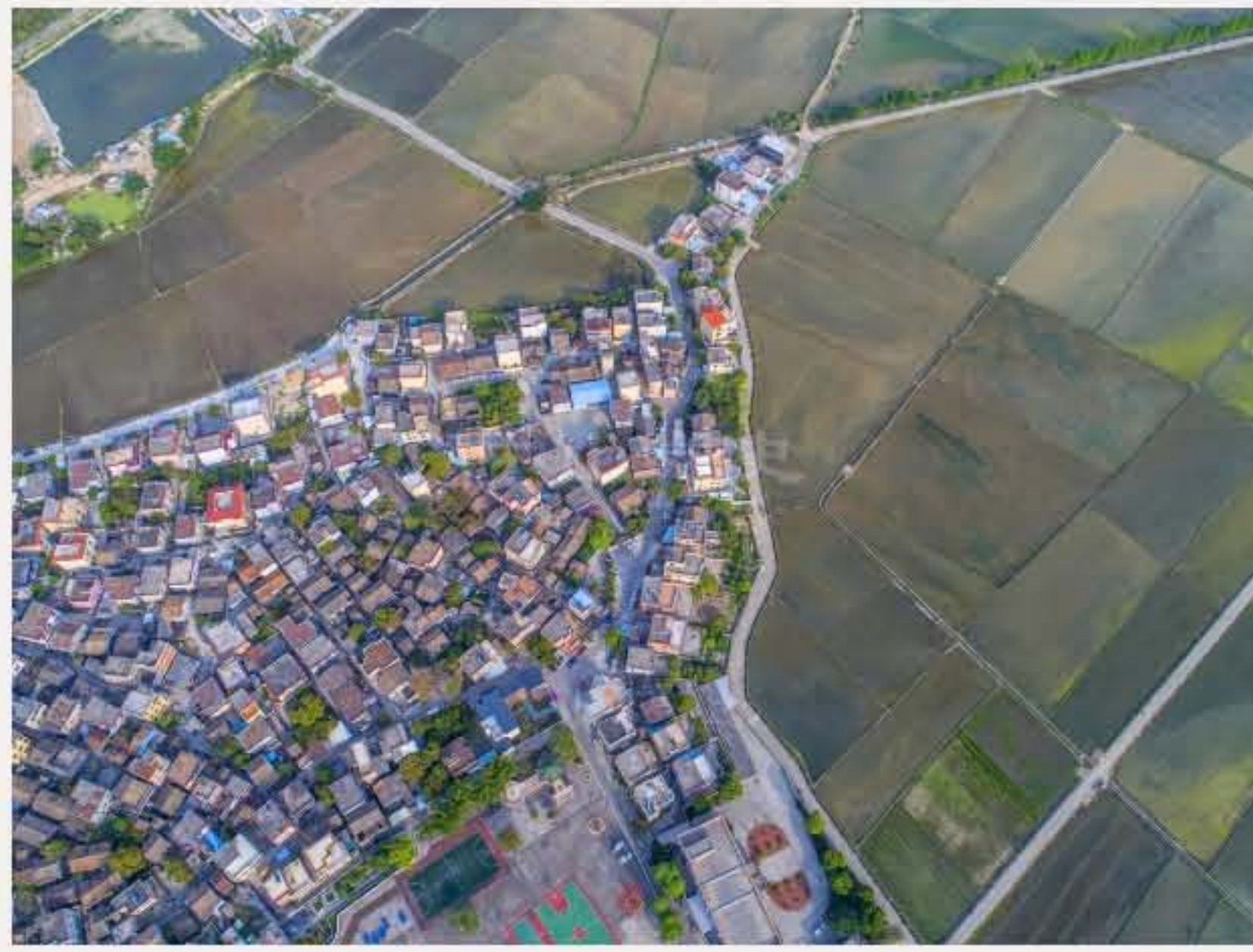
▲ 南朗街道崖口陆家村。（2018年4月）