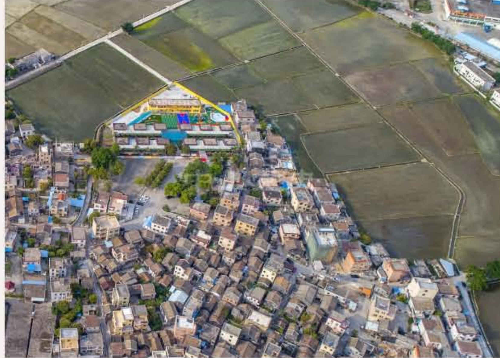
▲ 南朗街道崖口杨家村。黄春华摄（2018年4月）