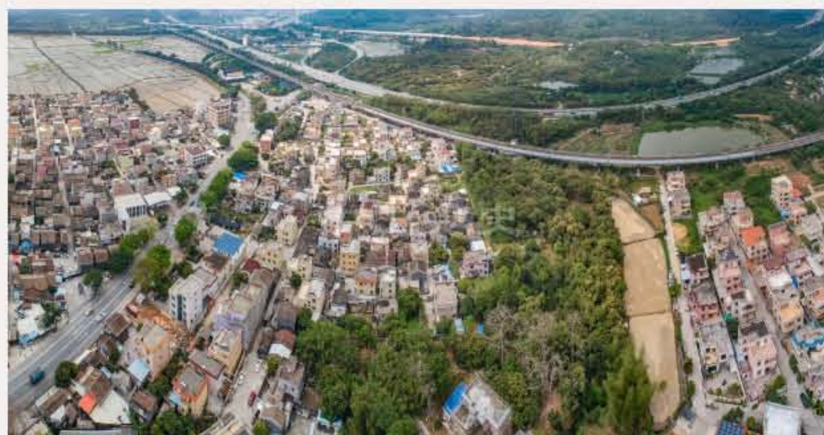
▲ 南朗街道崖口行政村的平山村（右）和西堡村（左）。黄春华摄（2020年3月）