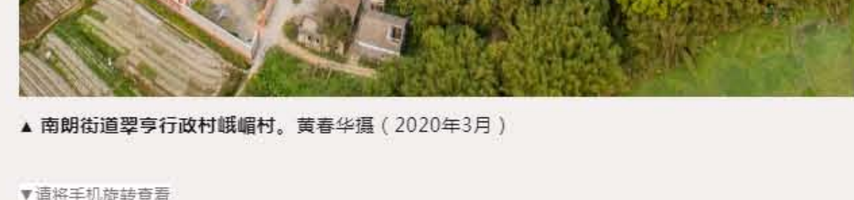
▲南朗街道翠亨行政村峨嵋村。（2020年3月）

徐同（1925—1947），革命烈士。1943年5月参加中山抗日游击队，1947年3月在东坑村作战牺牲。牺牲前是中山特派员北平队队员。