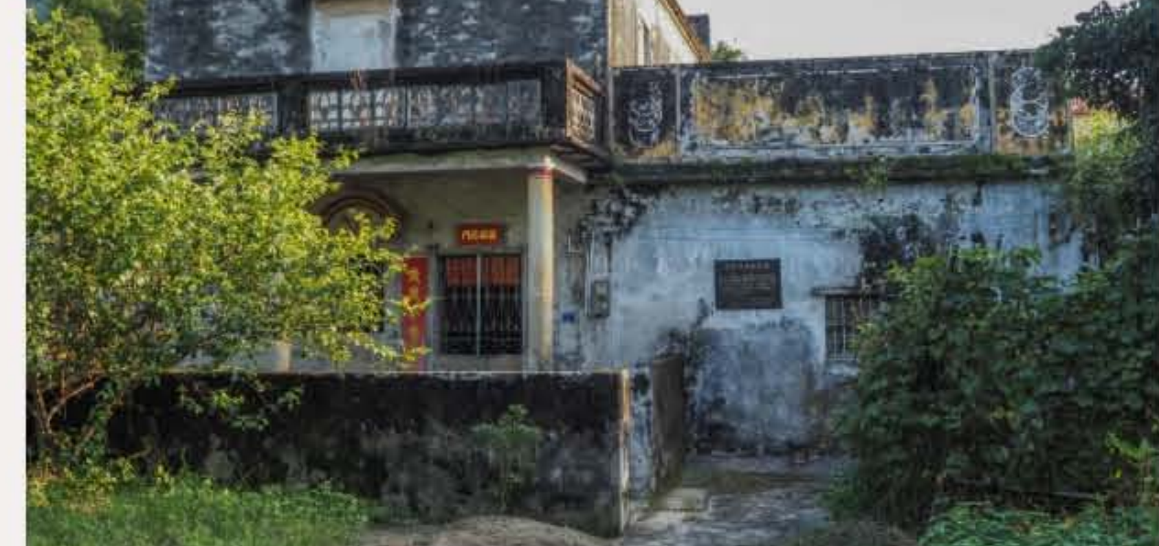
▲石门乡农会旧址。黄春华摄（2020年10月）

世居村民主要为谢姓。世居村民为汉族，客家民系，使用客家方言。2018年末，该村户籍人口37人。