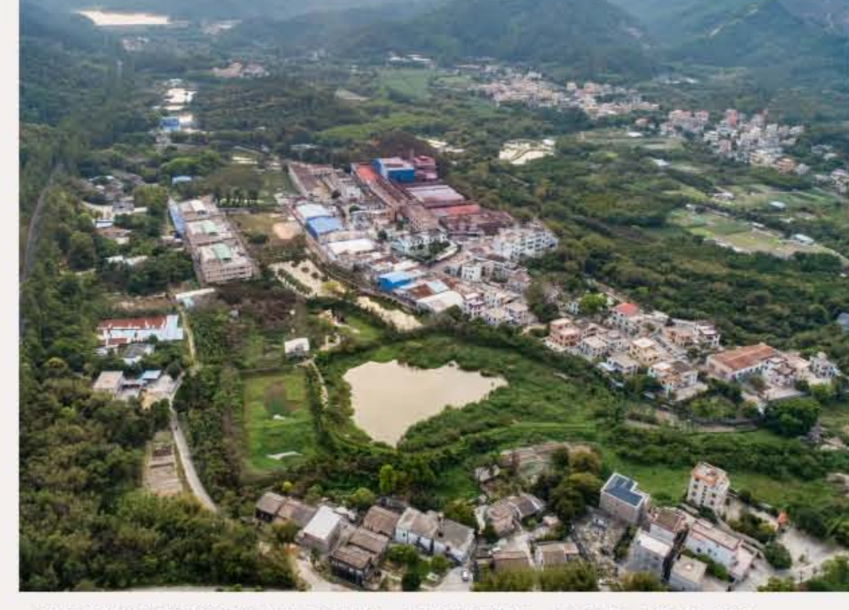
▲图中前为南朗街道翠亨行政村木子埔村，中间为张落坑村。黄春华摄（2020年3月）