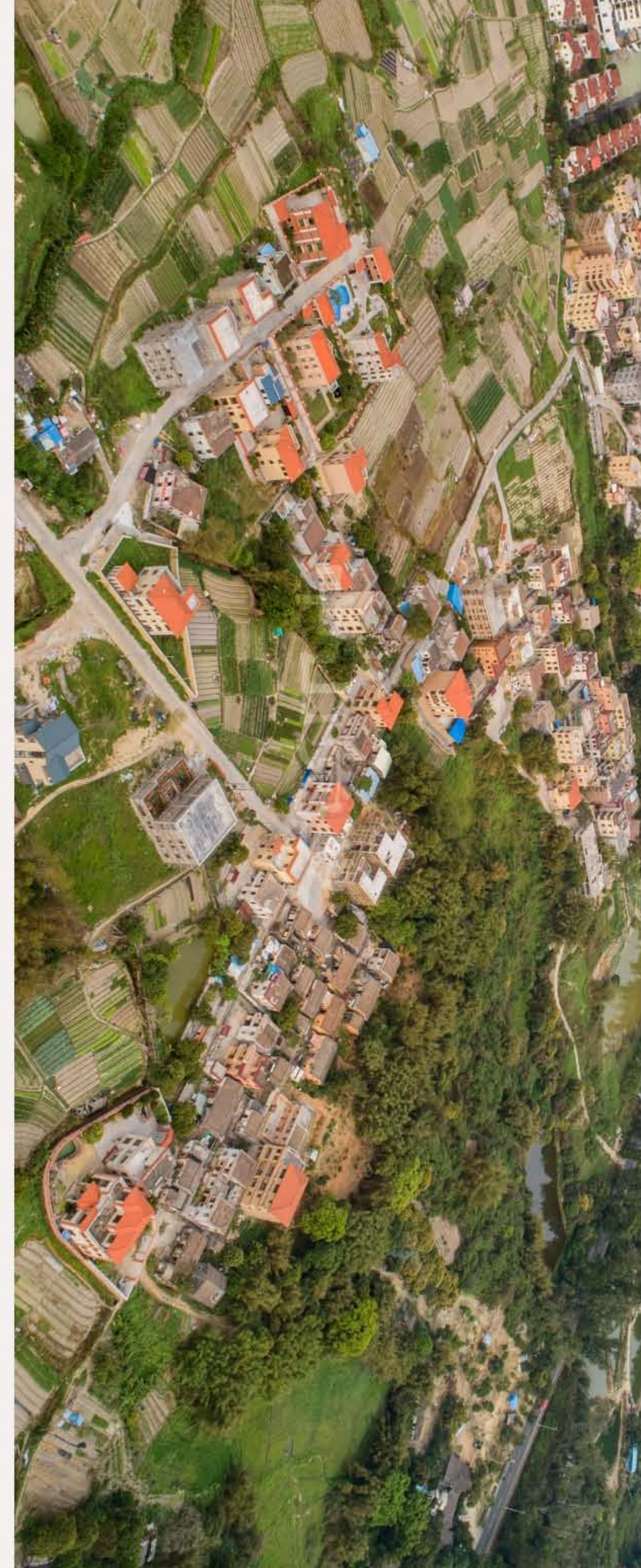
▲南朗街道翠亨行政村峨嵋村。（2020年3月）