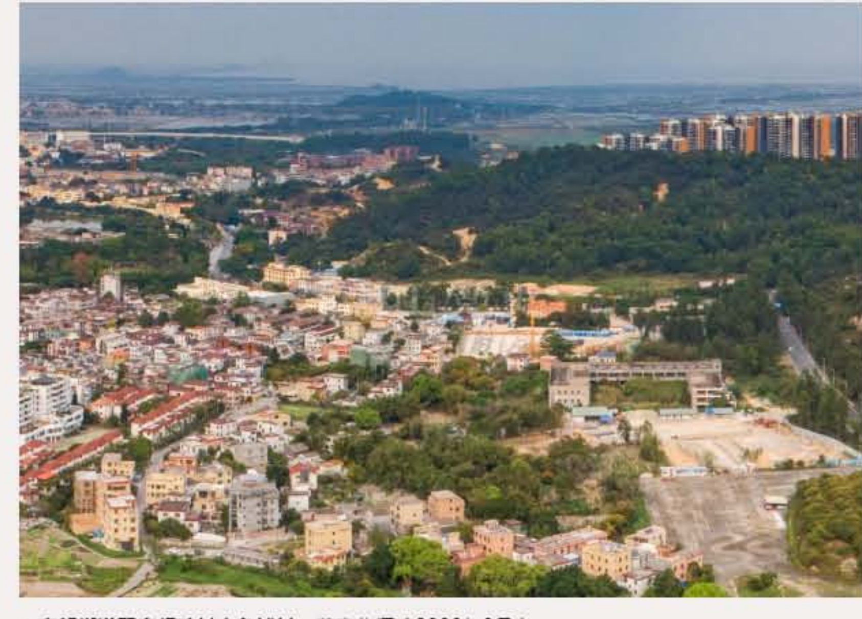
▲南朗街道翠亨行政村大家埔村。（2020年3月）