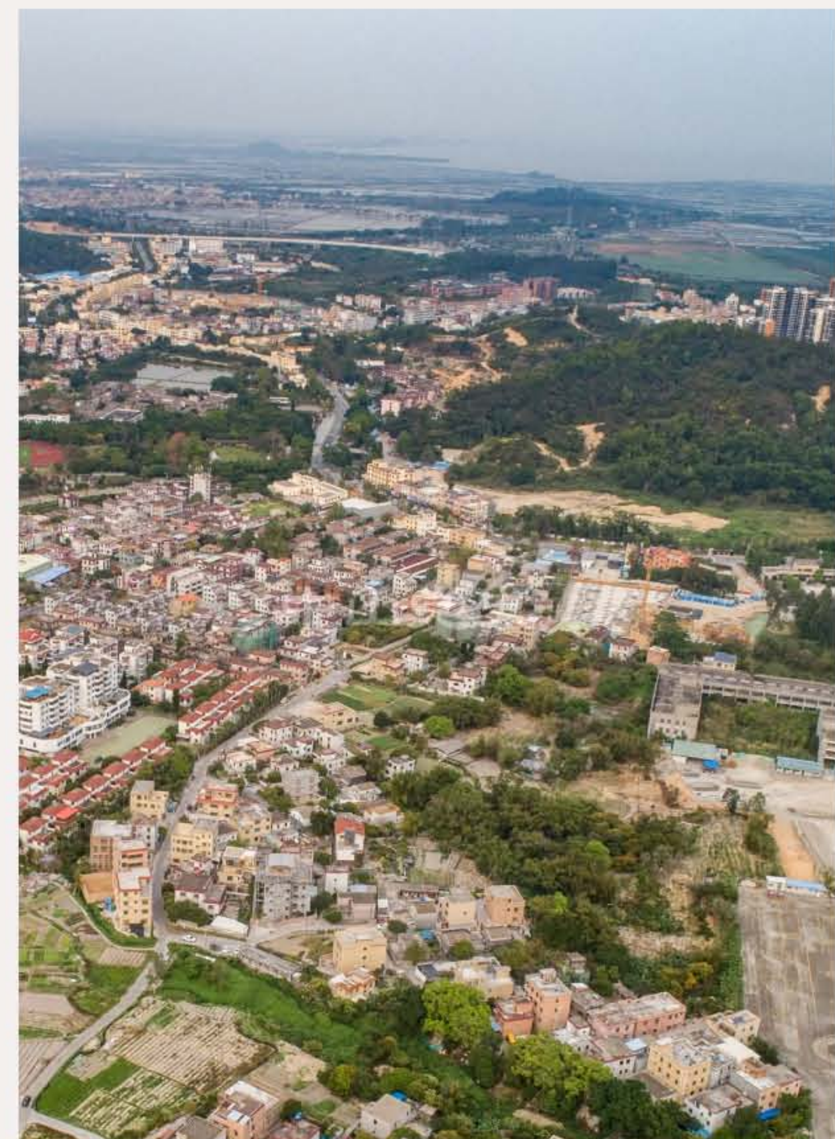
▲南朗街道翠亨行政村大家埔村及其周边环境。（2020年3月）

甘子唐（1927—1998），1943年10月参加中山人民抗日游击队，1944年加入中国共产党，1945年5月在抗击日、伪军的三山虎战斗中负伤，被授予“战斗英雄”称号。1949年6月任中山特派员北平队队长。中华人民共和国成立后，曾任中山县委副书记，政协中山市（市）第三届、第四届常委副主席等职。